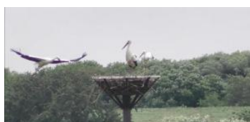
渡良瀬遊水池 (認定：2012年7月)