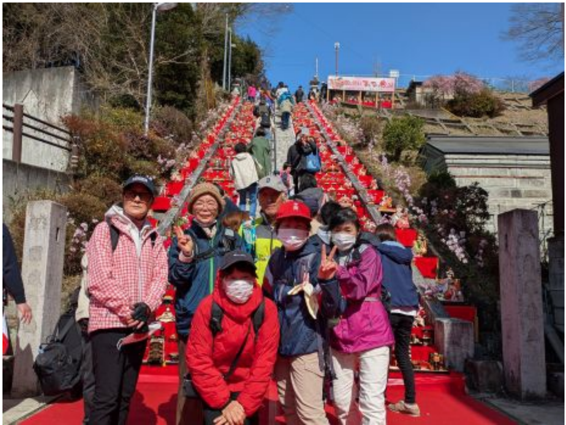
階段を登る前に記念撮影