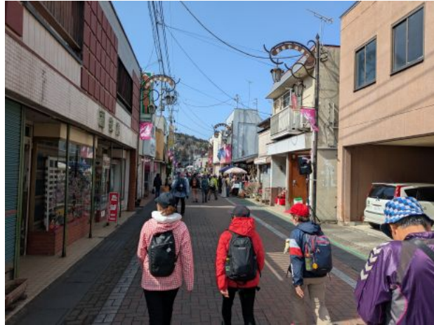
常陸大子駅前通りに到着、車通行止めで歩行者天国です