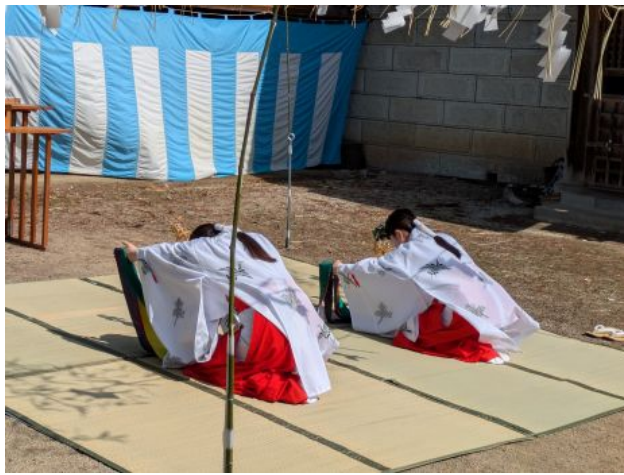
十二所神社では巫女さんの舞が行われていました