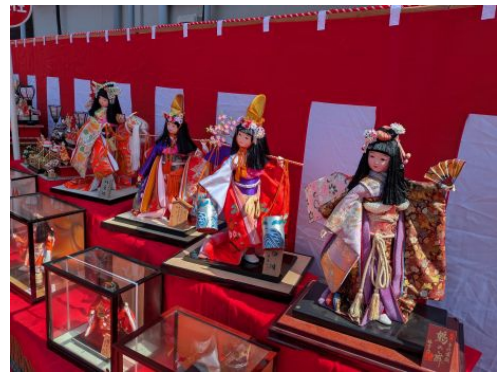
階段手前にもお雛様が