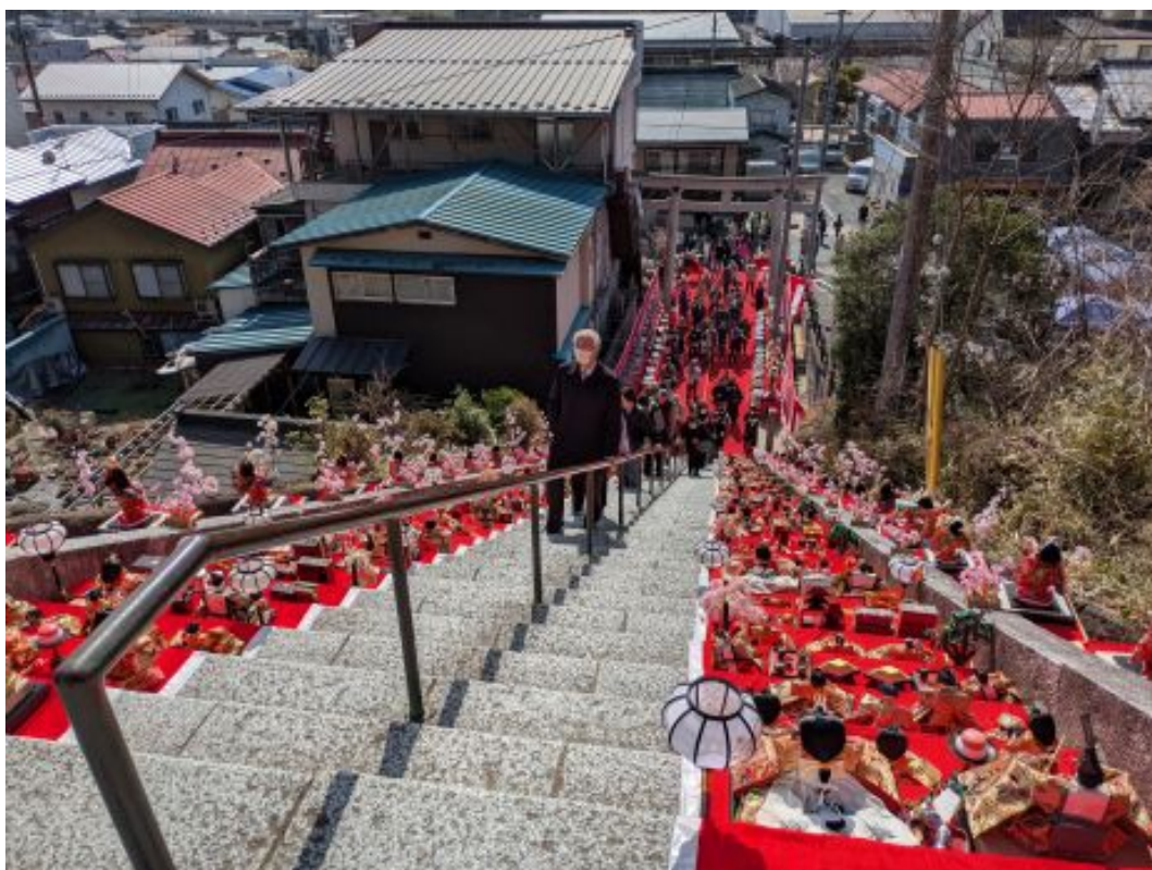
100段階段の上から、登りの一方通行です