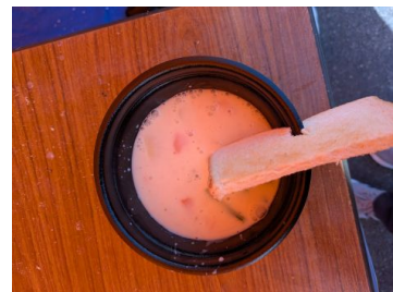
駅前の「まいん駐車場」では奥久慈しゃも1000人鍋ミルクホワイト 一杯500円 美味しくいただきました 他に しゃも弁当、アップルパイ 有り