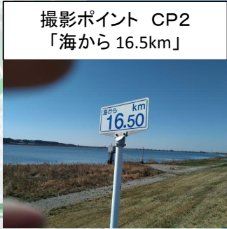
撮影ポイント CP2 「海から16.5km」

堤防は工事中であるが全線歩行可能。但し工事の状況により通行止め等の規制がある場合はそれに従うこと。堤防下の道路、又は国道124号線(旧道)に迂回願う。