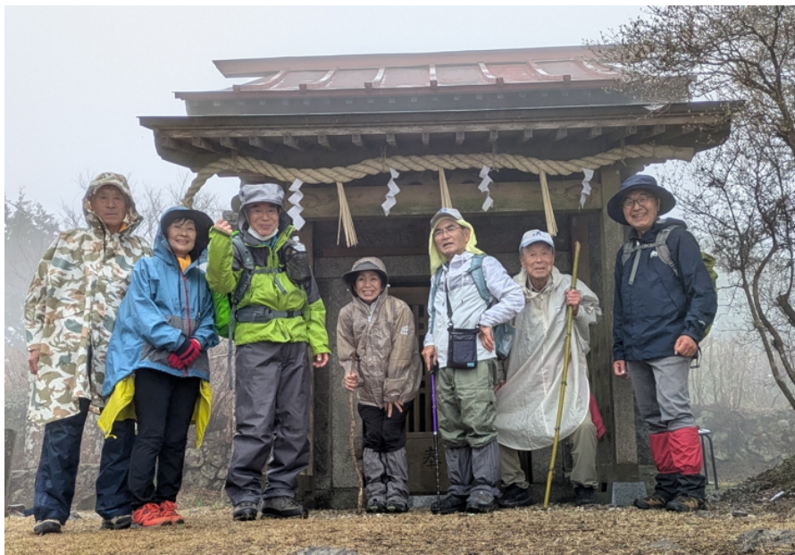
そこから少し登ると吾国山山頂です。 カタクリの花を堪能しているベテランチームと別れてヤングチームで山頂で 記念撮影。 残念ながらキリで遠望は出来ませんでした。