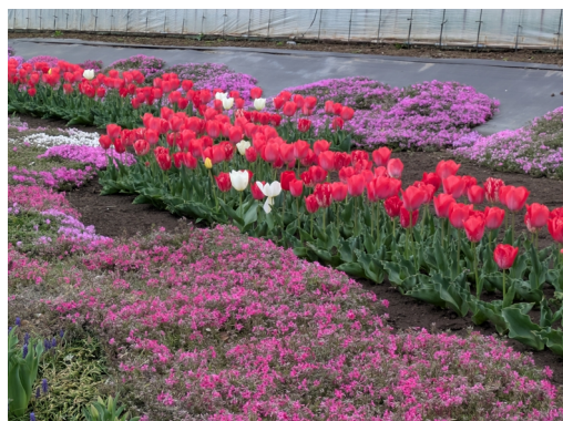
芝桜とチューリップ

約3km歩いて登山口に到着。ここから登り坂が始まります。カタクリの里迄は平らな所がほとんどなく登りが続きます。一本道なので、自分なりのペースで登るため自由歩行とし、中間地点の林道で一度集合として登山開始です。