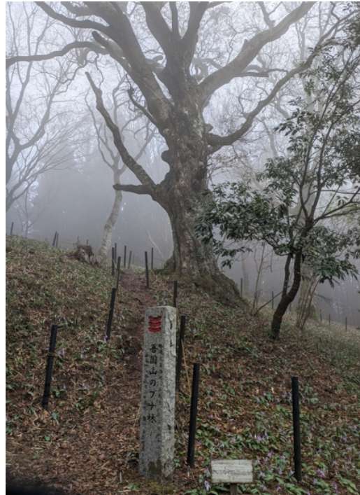
カタクリの里のすぐ上はブナ林となっています。