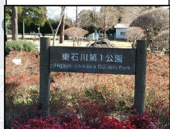
撮影ポイント CP3 東石川第一公園