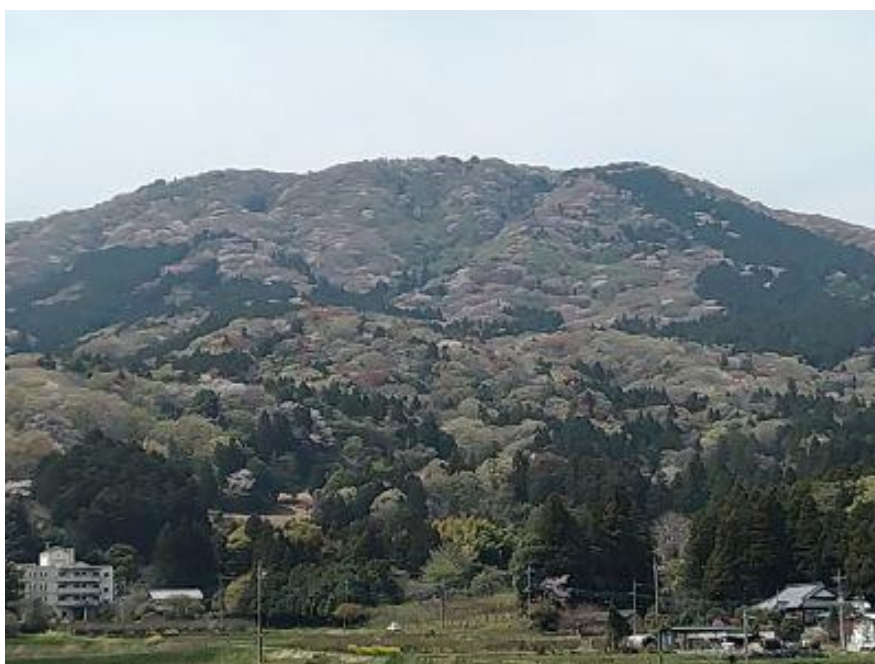
難台山の斜面が若葉と桜のグラデーション (写真が上手くとれていません)

地元の人には失礼ですが、田舎の原風景を感じ心安らぐひと時でした。 約一時間で無事岩間駅到着、皆様ご苦労様でした。