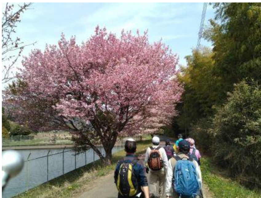
麓では八重桜が満開