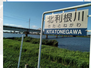
撮影ポイント 9 鹿島線高架&看板