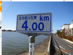
撮影ポイント 3 潮来ホテル横