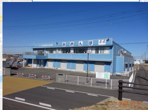
撮影ポイント 2 ポートセンター