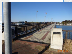
撮影ポイント 7 潮来大橋歩道橋