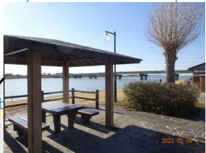
撮影ポイント 5 牛堀休憩所