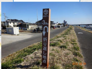
撮影ポイント 4 HR折り返し点