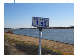
撮影ポイント 1 日の出