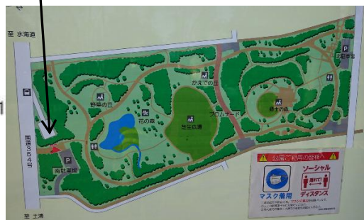
赤塚公園 稲荷神社 南駐車場横

LINE 写真撮影ポイントと順序 赤塚公園スタート ポイント1 → ポイント2 → ポイント1 TX駅スタート ポイント3 → ポイント2or1 → ポイント1or2 → ポイント3