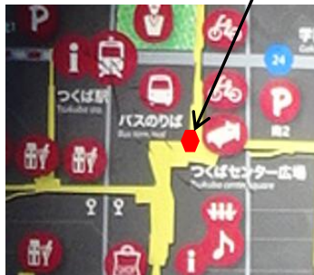
ホテル日航つくば バスのりば横の階段を登った広場